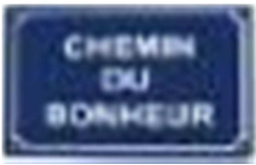
Tafel mit Strassennamen