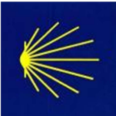
Muschelkleber gelb/blau; Europäische Signalisation