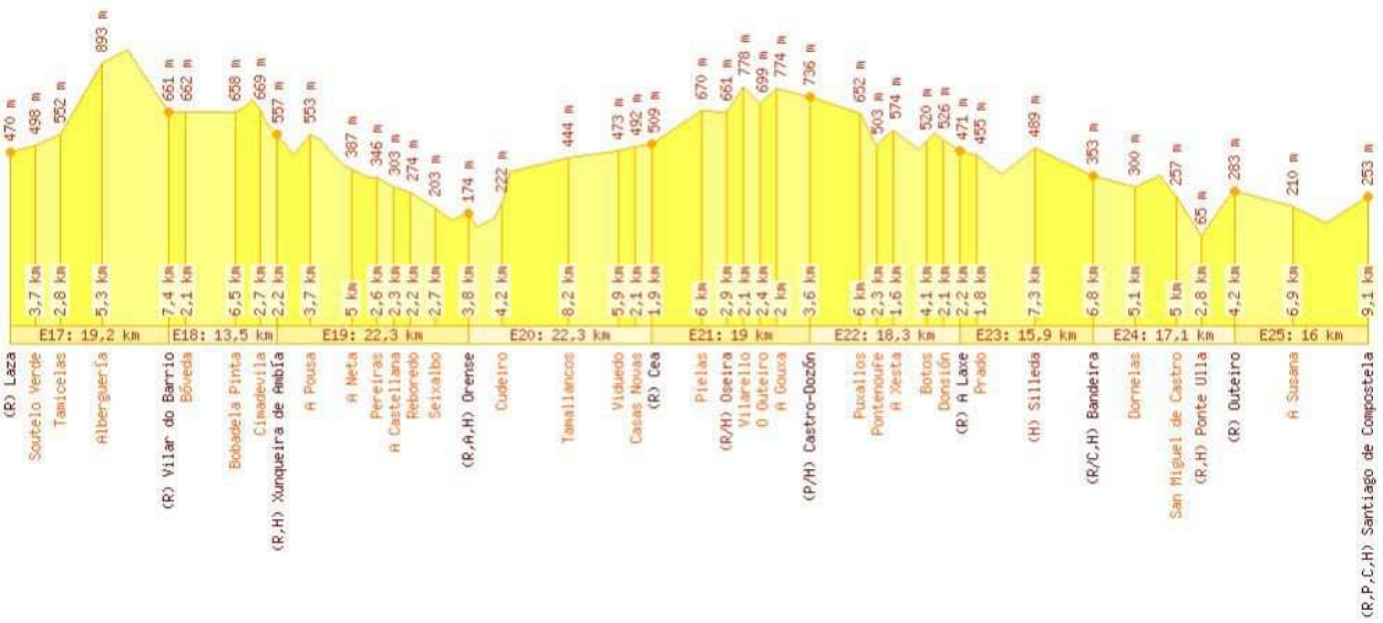
Gráfica generada por Godesalco.com para Flavio el 15 de febrero de 2008

Parte III del viaje desde Salamanca hasta Santiago de Compostela (477,6 km) por la Vía de la Plata. Se muestran las altitudes y distancias parciales de las 13 localidades con alojamiento y de otros 29 puntos. R: albergue de peregrinos público. P: albergue de peregrinos privado. A: albergue juvenil. T: albergue turístico Alba Plata. C: camping. H: hotel, hostel, casa rural, pensión. FR: Fuera de la ruta.